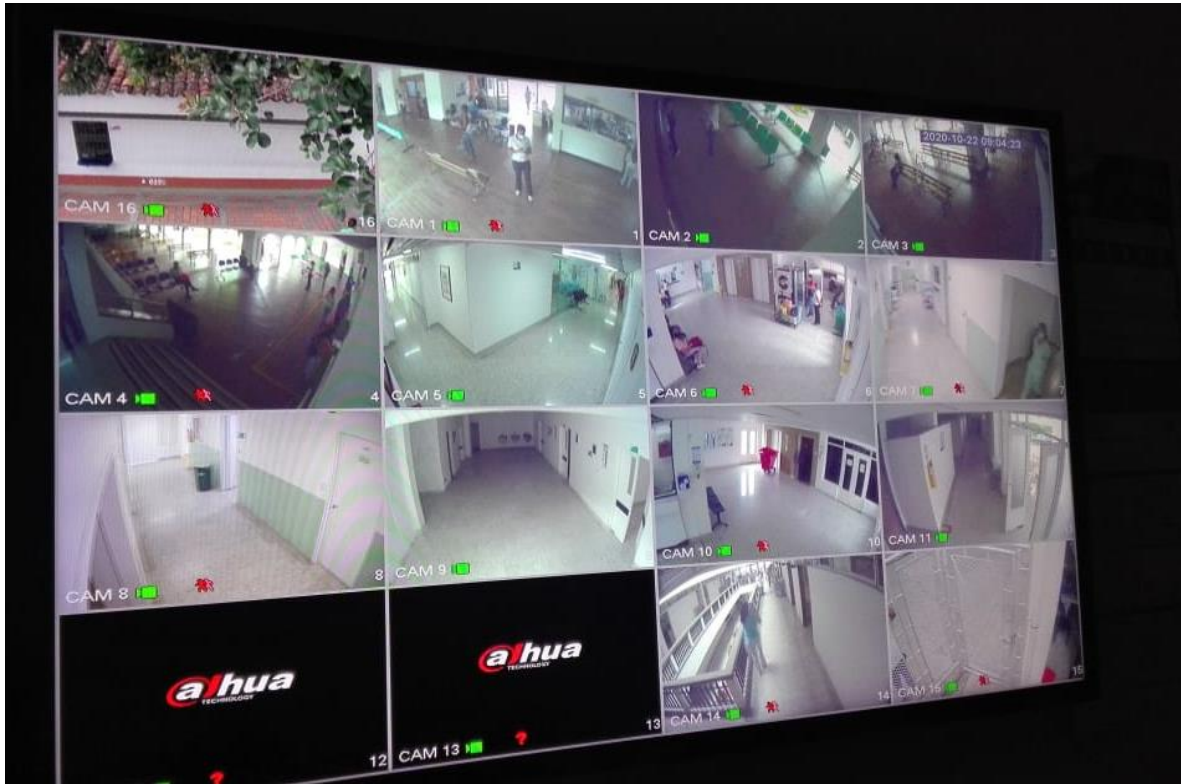
AREAS ASISTENCIALES (SIMULACION NACIONAL)